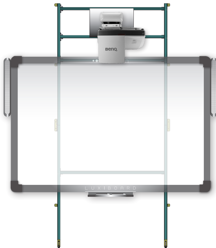
Esempio di installazione con LIM e videoproiettore ad ottica ultracorta